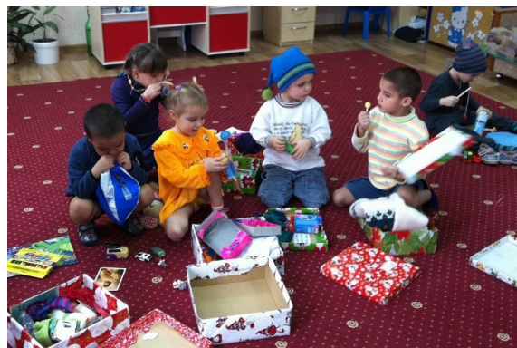
MYND FRÁ BARNAHEIMILI Í ÚKRANÍU, BÚIN AÐ FÁ GJAFIR