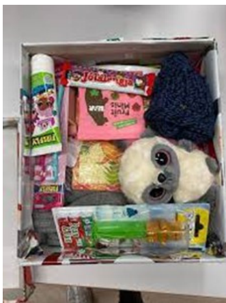
EITT OG ANNAÐ SEM FÓR Í KASSANN